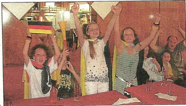
Public Viewing - 4:0 für Deutschland - die Freude kennt keine Grenzen!

Pünktlich um 16 Uhr drängten nun die Fußballfans und wurden in die vielen Straßenkneipen mit Bildschirm oder Leinwand entlassen. Ein paar weniger Fußballbegeisterte folgten weiterhin der Stadtführerin und verpassten einen grandiosen Sieg der deutschen Fußballmannschaft. Dass auch für Schwäbisch Hall Public Viewing und Siege feiern keine Fremdworte sind, erlebten die Oberreichenbacher hautnah mit und schlossen sich den feiernden Hallern an.